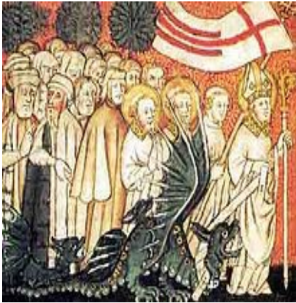
Crodegango di metz (762)

Associazione di suffragio per i membri defunti (monaci e sacerdoti) Confraternite sacerdotali