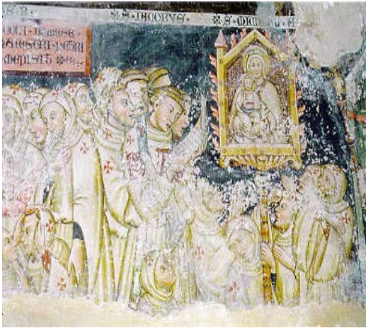
I «bianchi» di Alessandria

Attesa di una rigenerazione della Chiesa 'in capite et in membris', devozione alla Vergine come mediatrice di misericordia e preghiera per la di pace