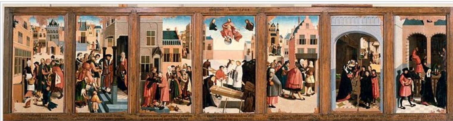
Le Opere di Misericordia , da parte del Maestro di Alkmaar fatte per la Chiesa di San Lorenzo a Alkmaar, Paesi Bassi . I pannelli di legno mostrano le opere di misericordia in questo ordine: dar mangiare agli affamati, dar da bere agli assetati, vestire gli ignudi, seppellire i morti, alloggiare i pellegrini , visitare i malati, e visitare i carcerati. Circa 1504..

RIASSUMONO LE ATTIVITÀ SOCIALI DELLA CONFRATERNITA