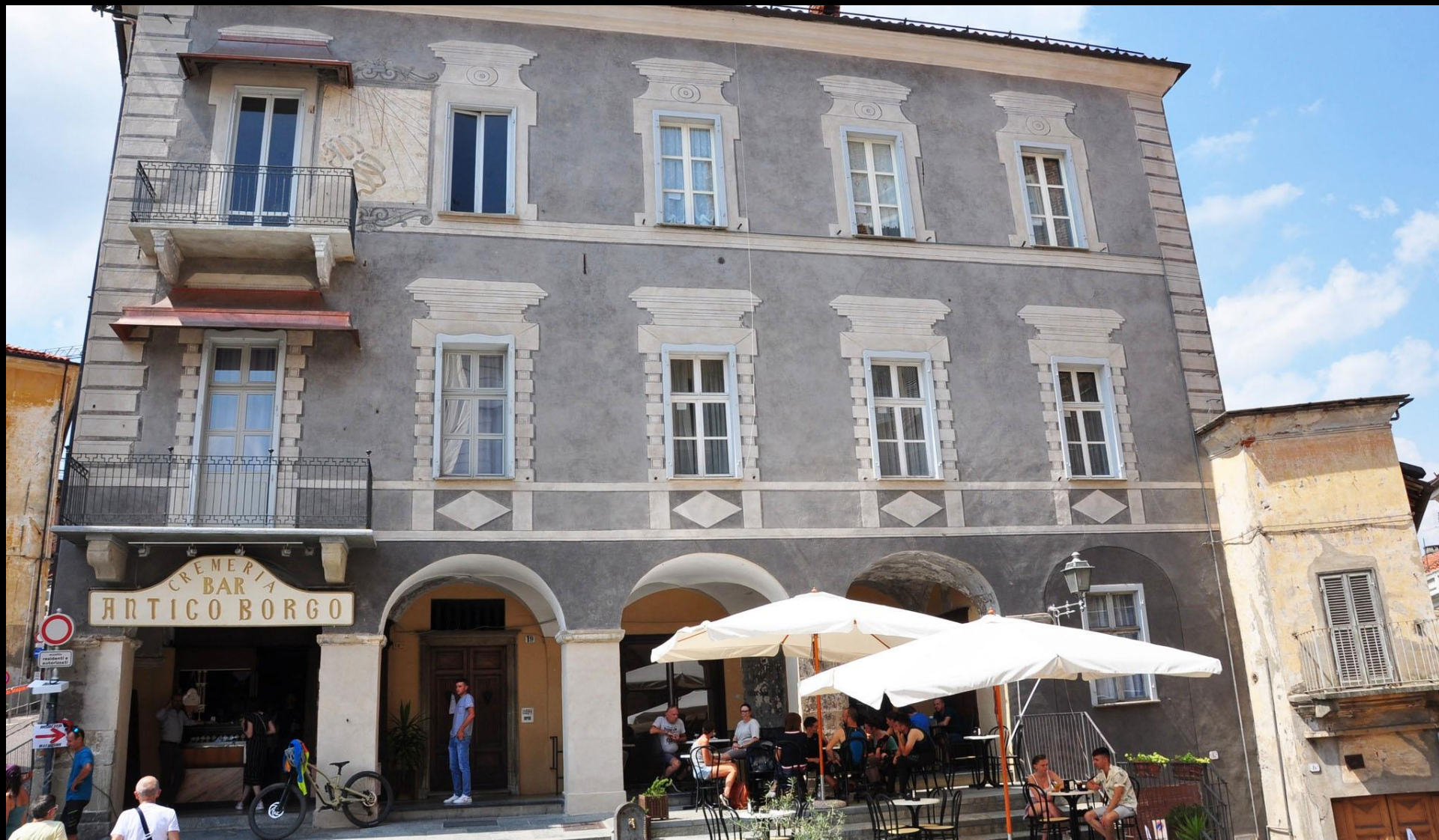
Mondovì Piazza, palazzo Castrucci