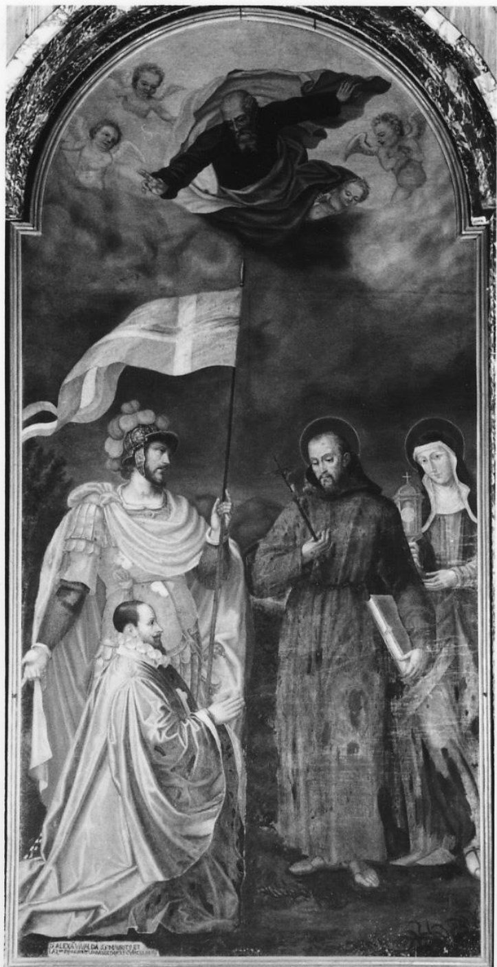
Pittore piemontese, Dio Padre e Santi (pala Fauzone), Mondovì, cattedrale, 1600 ca.