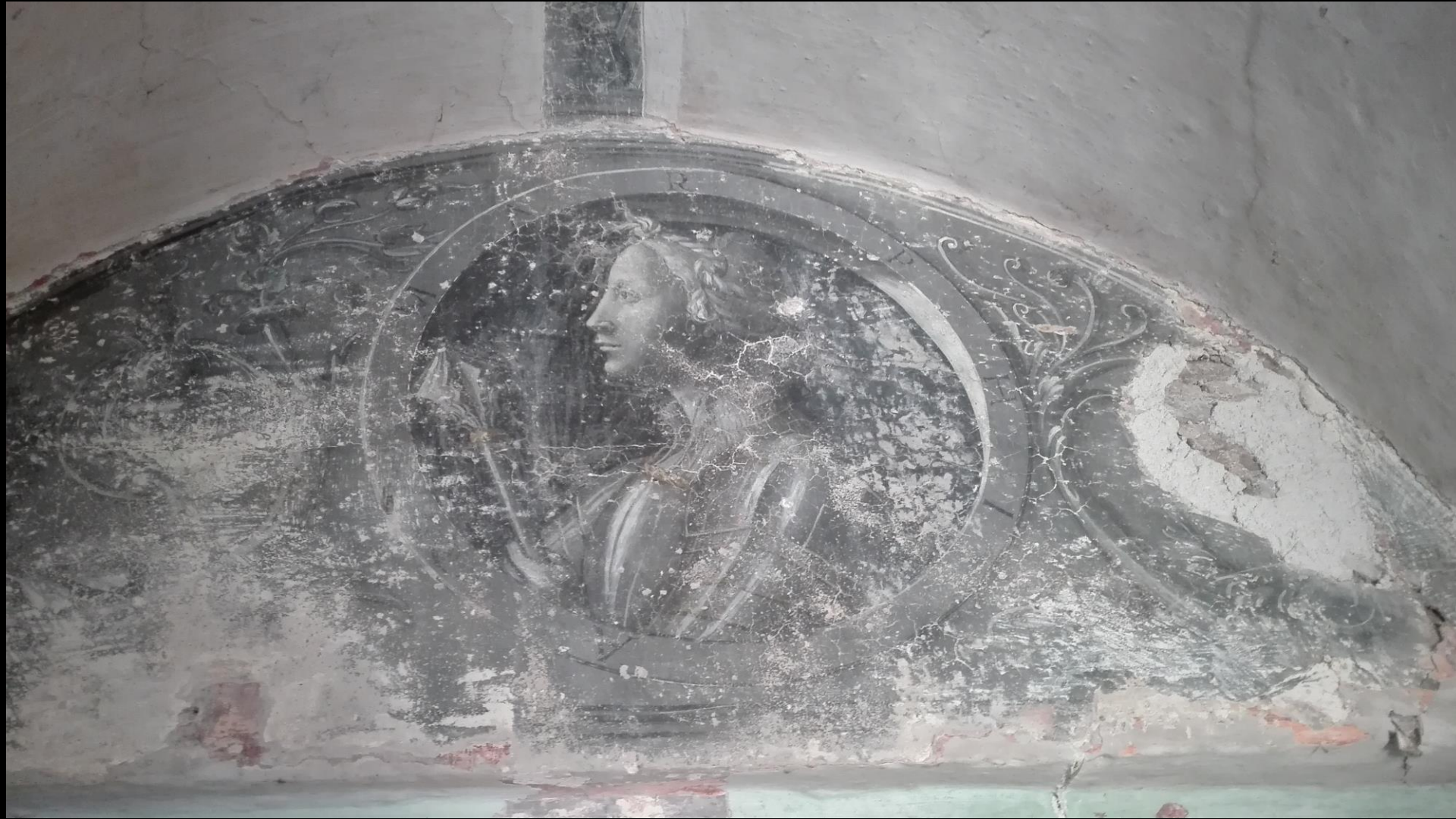
Pietro Dolce, Profilo femminile , Ceva, loggia di casa Pallavicino, 1550 circa.