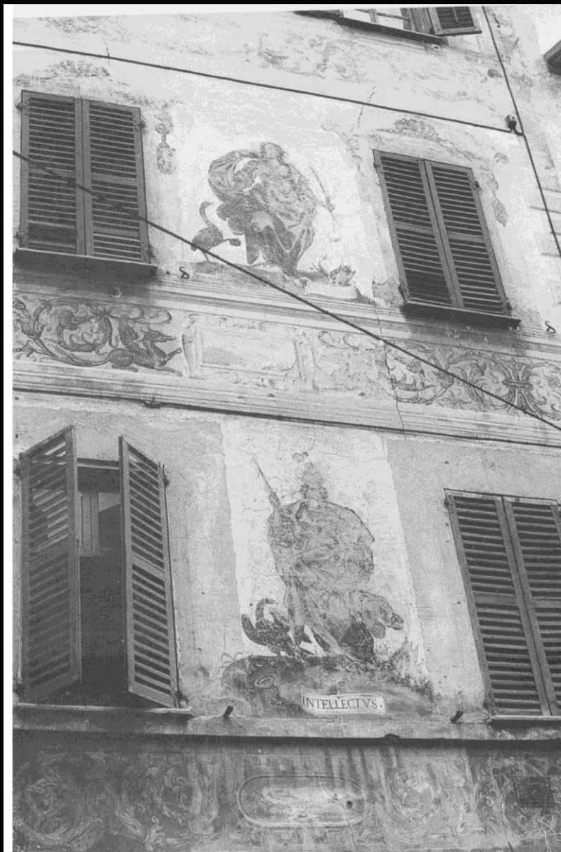
Pittore piemontese, Figure allegoriche , Mondovì Piazza, casa in via della Misericordia