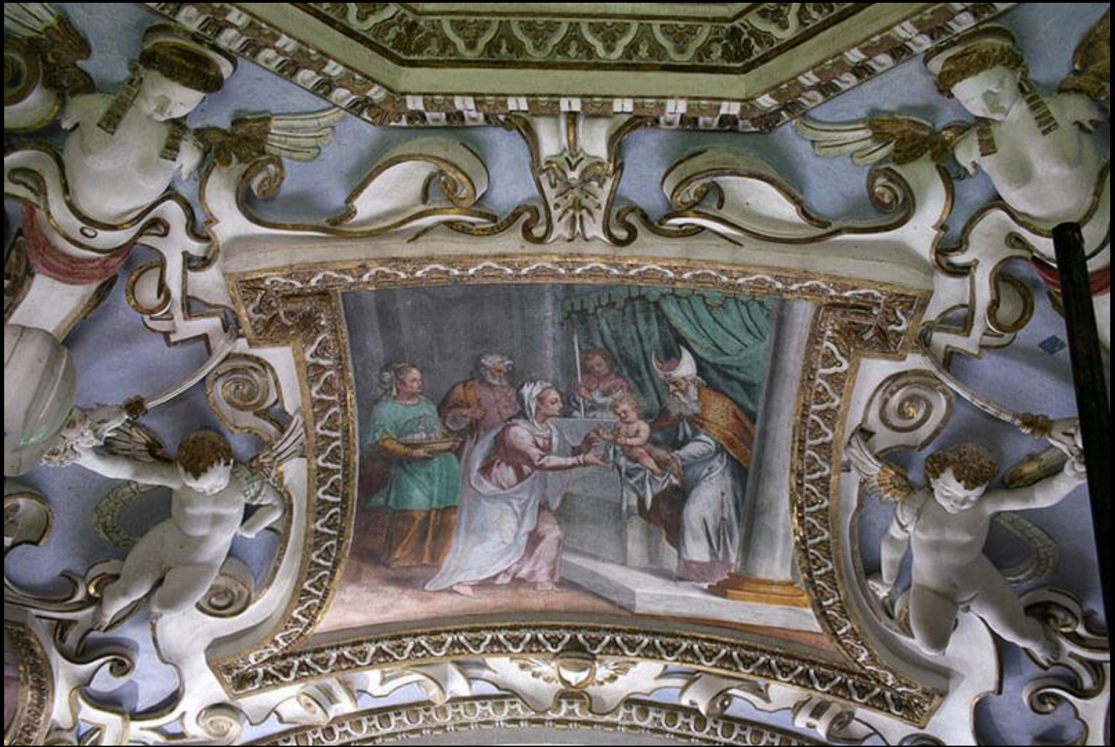
Antonino Parentani, Presentazione al tempio , certosa di Pesio, 1610.