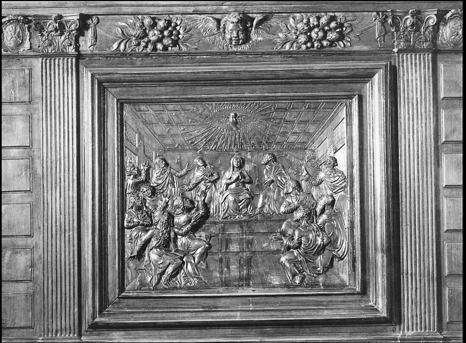
Intagliatore piemontese, pulpito del vescovo Castruccio, Mondovì, cattedrale, 1593