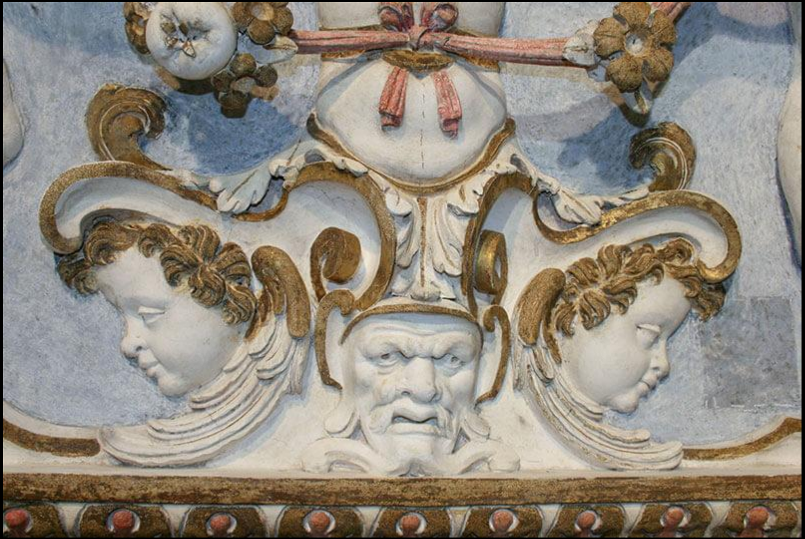
Stuccatore ticinese, grottesche, certosa di Pesio, 1610