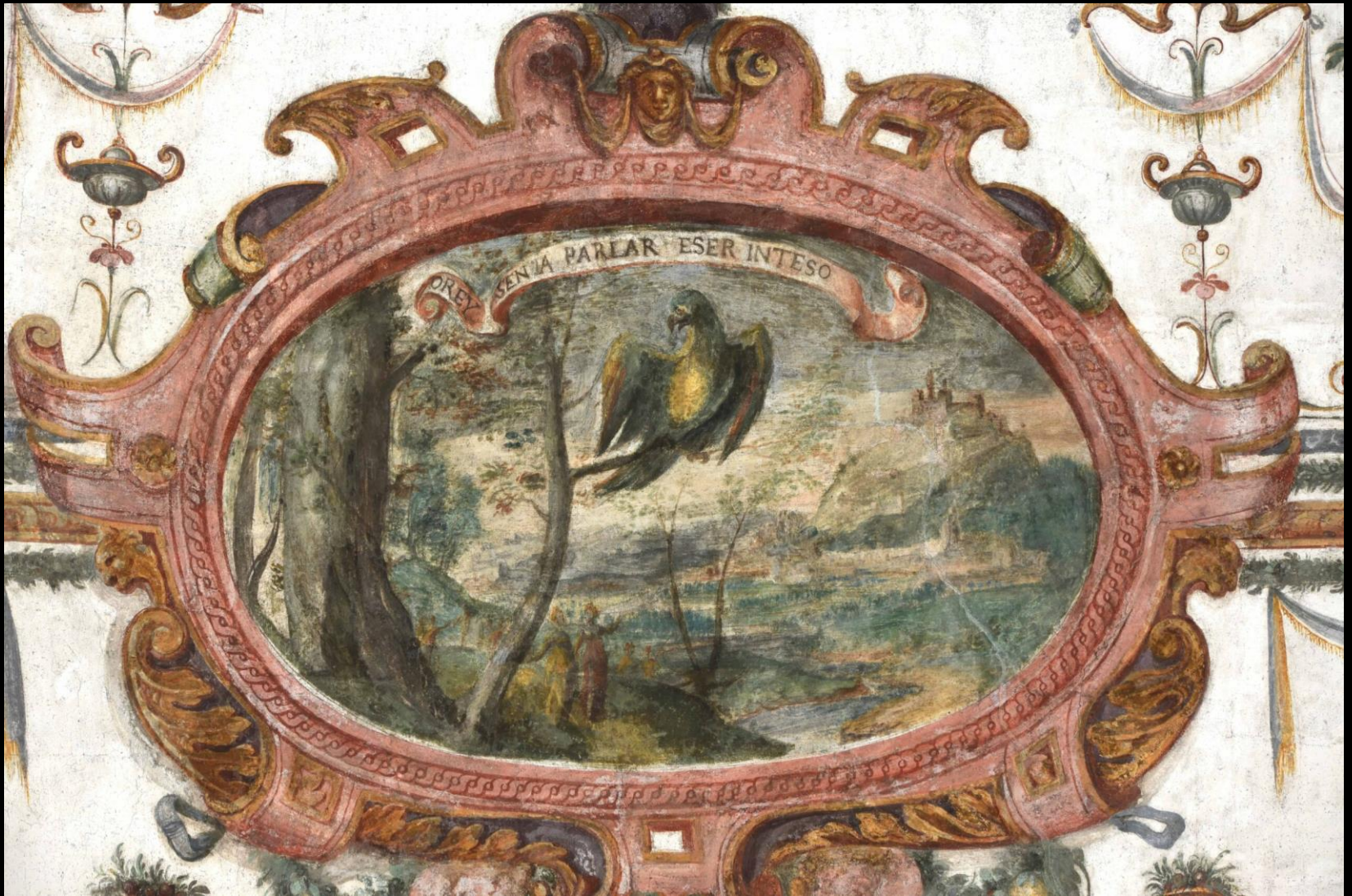
Giovanni Caracca, grottesche , Fossano, castello ducale,