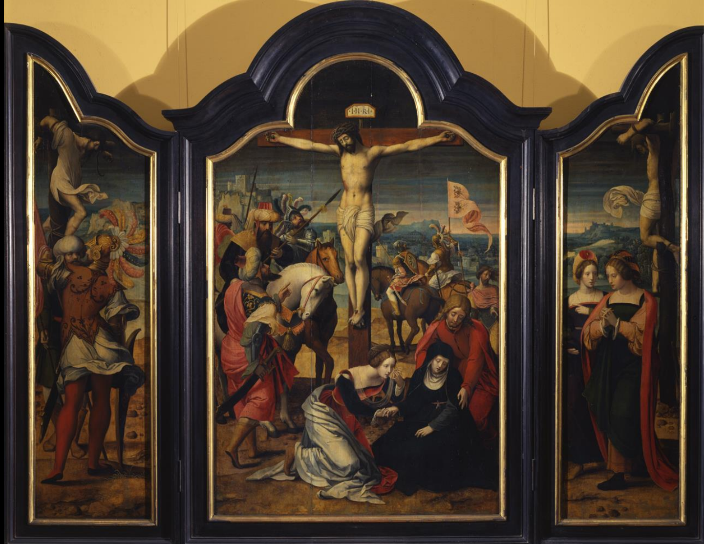
Maestro delle Mezze Figure Femminili, trittico della Crocifissione , Torino, Galleria Sabauda (dalla certosa di Pesio), 1540 ca.