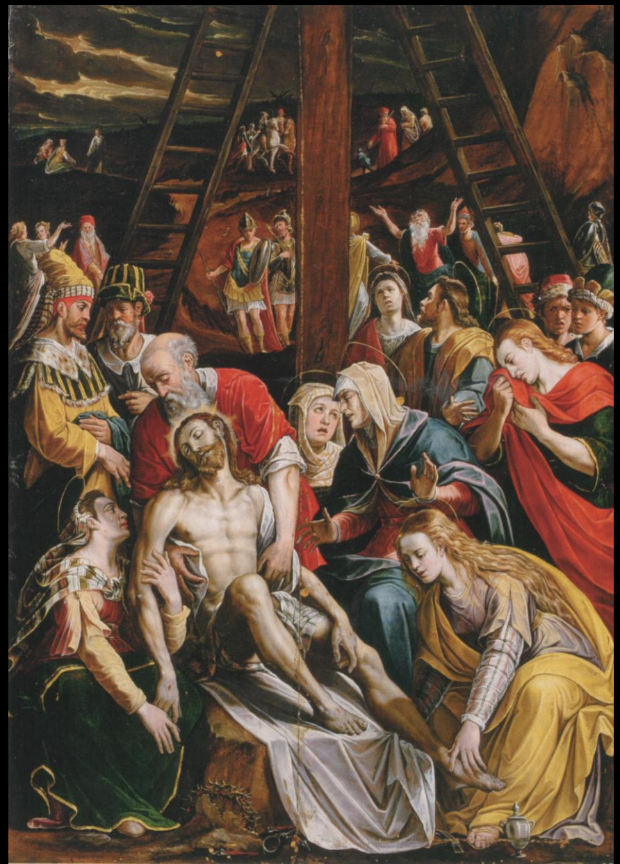
Alessandro Ardente, Compianto su Cristo , Revello, chiesa delle Romite (dal convento dei Cappuccini di Ceva), 1578 ca.