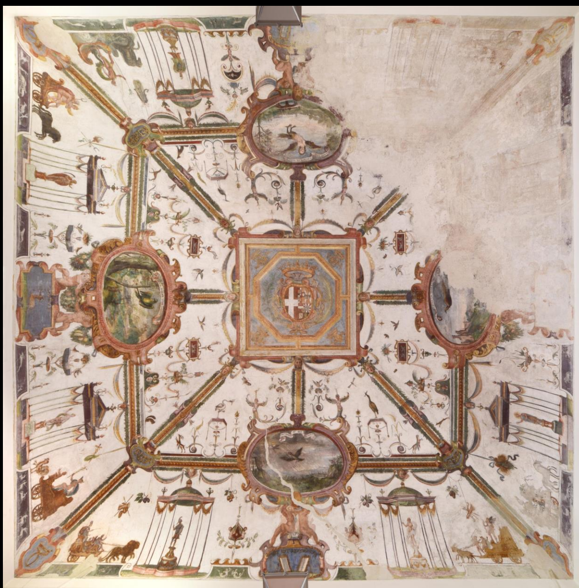
Giovanni Caracca (?), grottesche , Fossano, castello ducale,