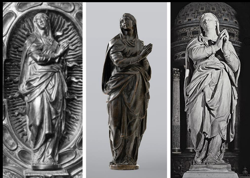
Annibale Fontana, tre versioni della Madonna di San Celso , 1590 ca.

Scultore lombardo, Santa Lucia , Villanova Mondovì, santuario di Santa Lucia, 1590 ca.