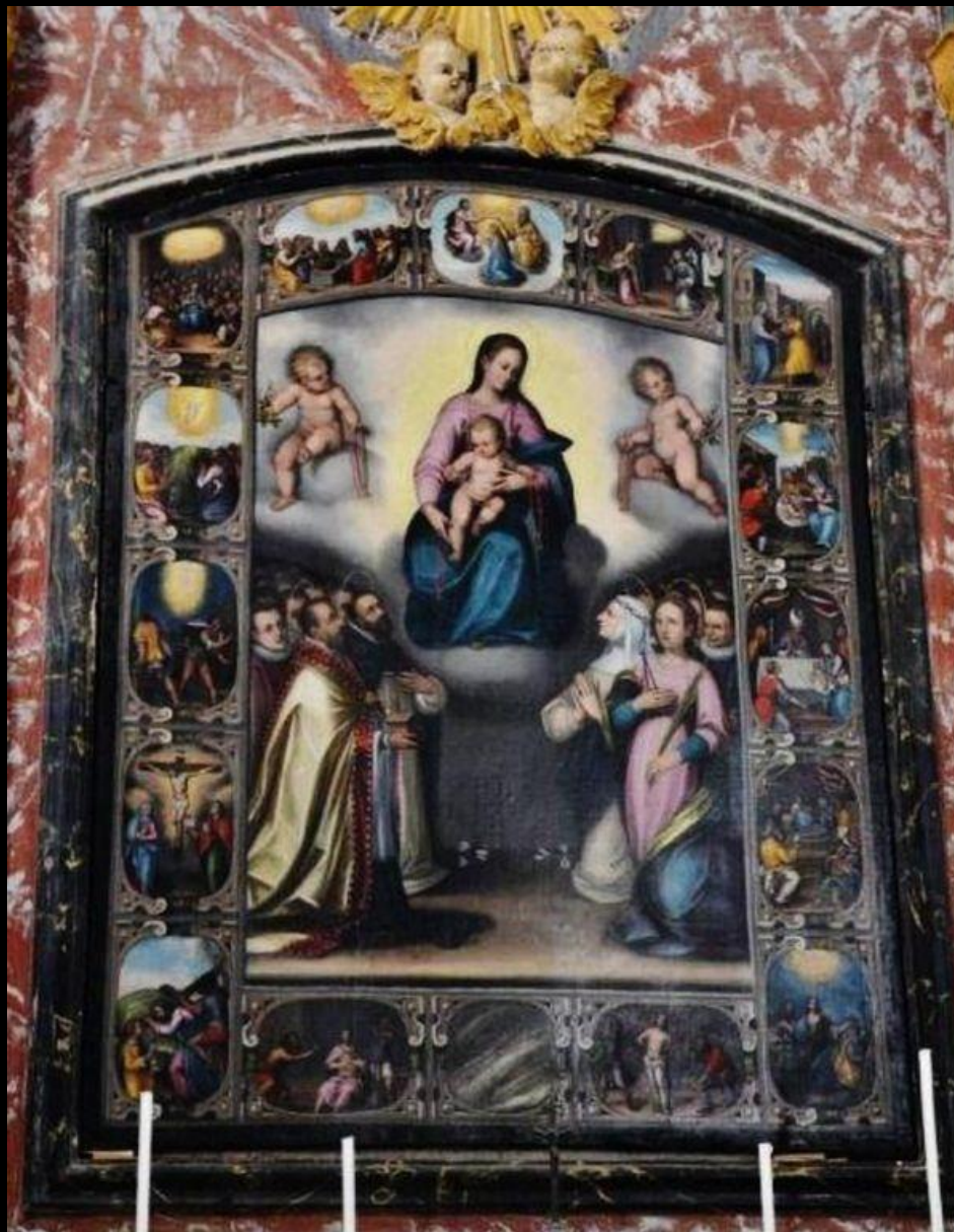
Guglielmo Caccia, detto il Moncalvo, Madonna con il Bambino, Santi, devoti e i Misteri del Rosario , Marsaglia, chiesa parrocchiale.