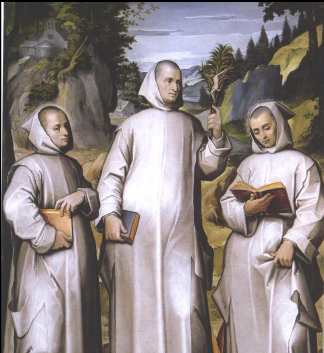
Antonino Parentani, San Brunone tra i beati Bivello e Guglielmo , Cuneo, chiesa della Madonna dell'Olmo (dalla certosa di Pesio), 1605 ca.