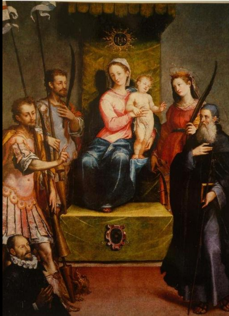
Antonino Parentani. Madonna con il Bambino e Santi , Torre Mondovì, chiesa parrocchiale