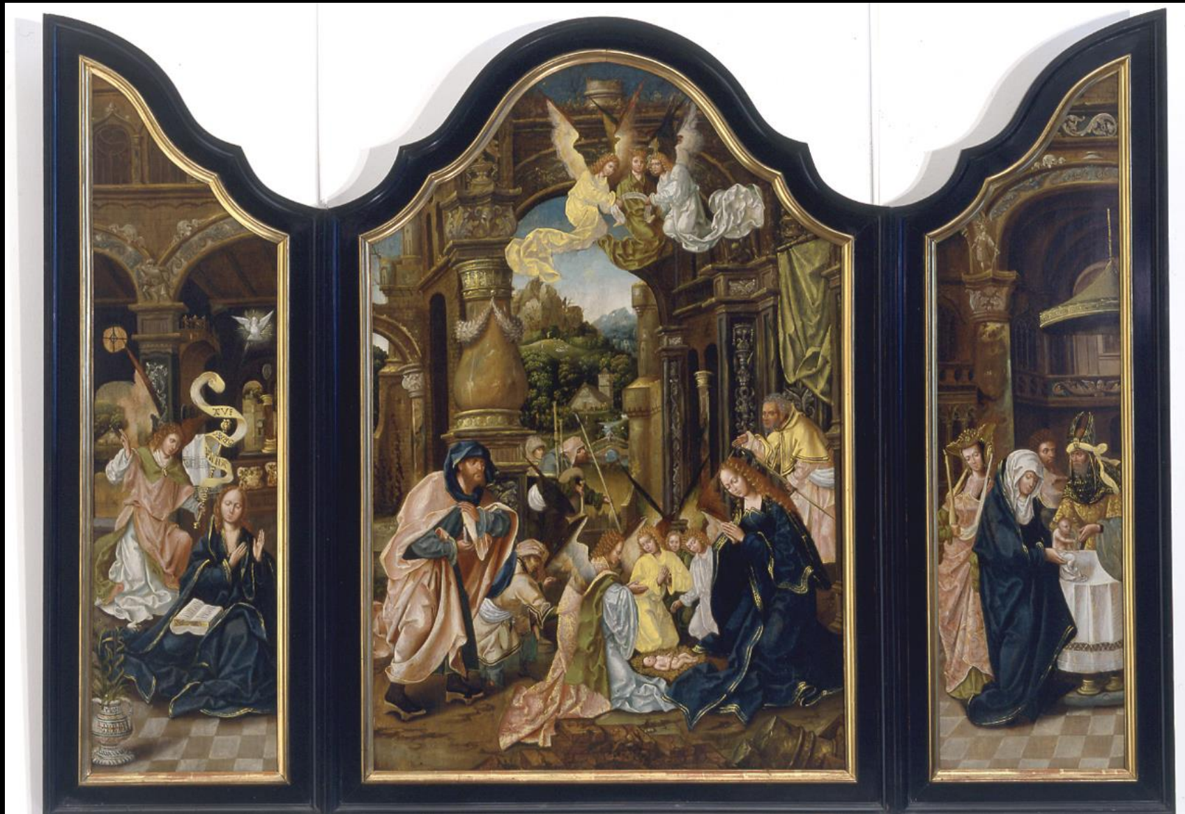
Manierista di Anversa, trittico dell'Adorazione del Bambino, Torino, Galleria Sabauda (dal santuario di Santa Lucia a Villanova Mondovì).