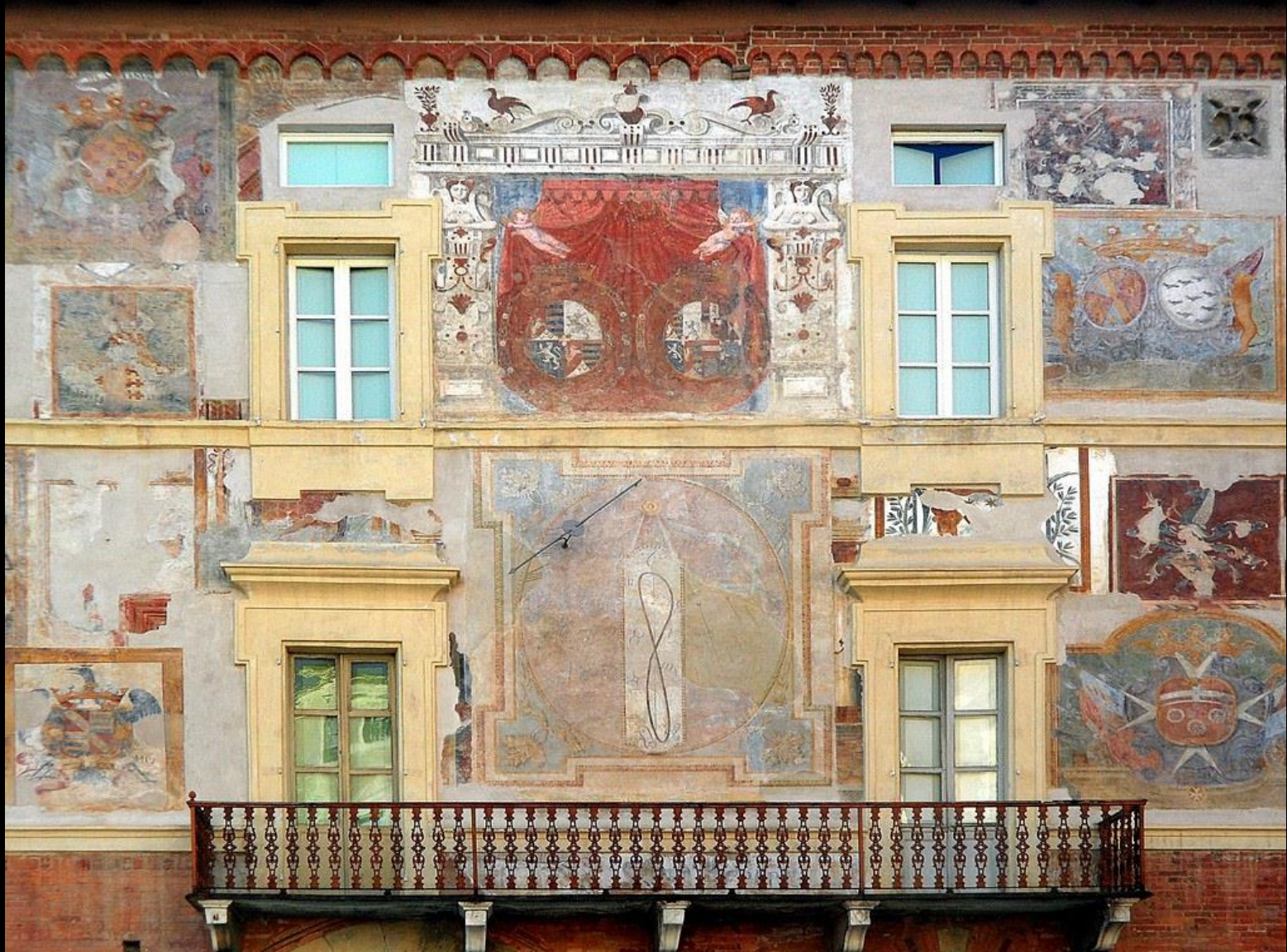
Mondovì Piazza, palazzo dei Governatori