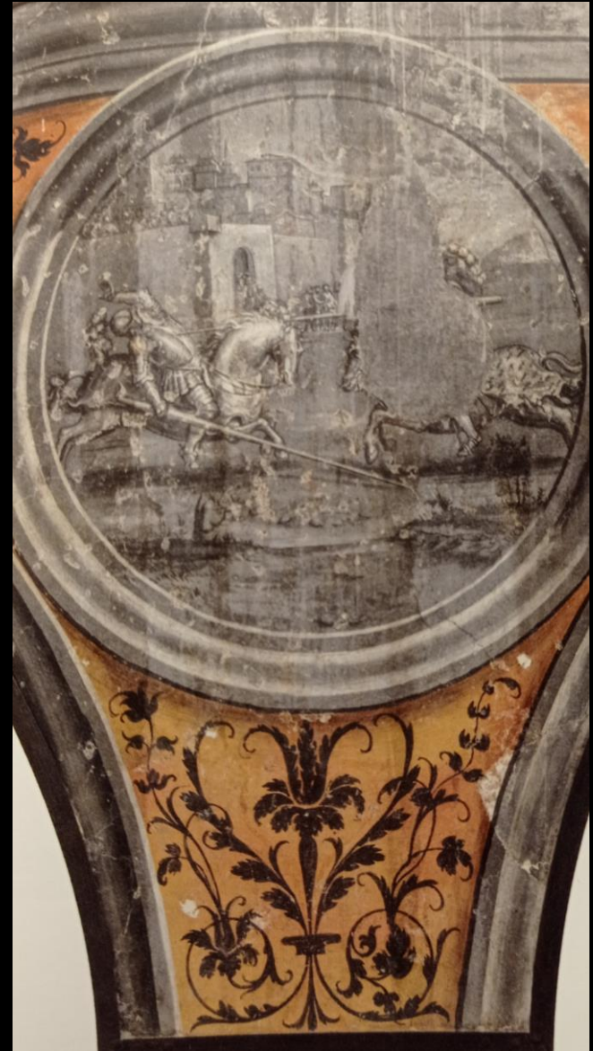
Pietro Dolce, Scene dall'Orlando Furioso , collezione privata (da Chiusa Pesio, casa dei Marchesi di Ceva), 1550