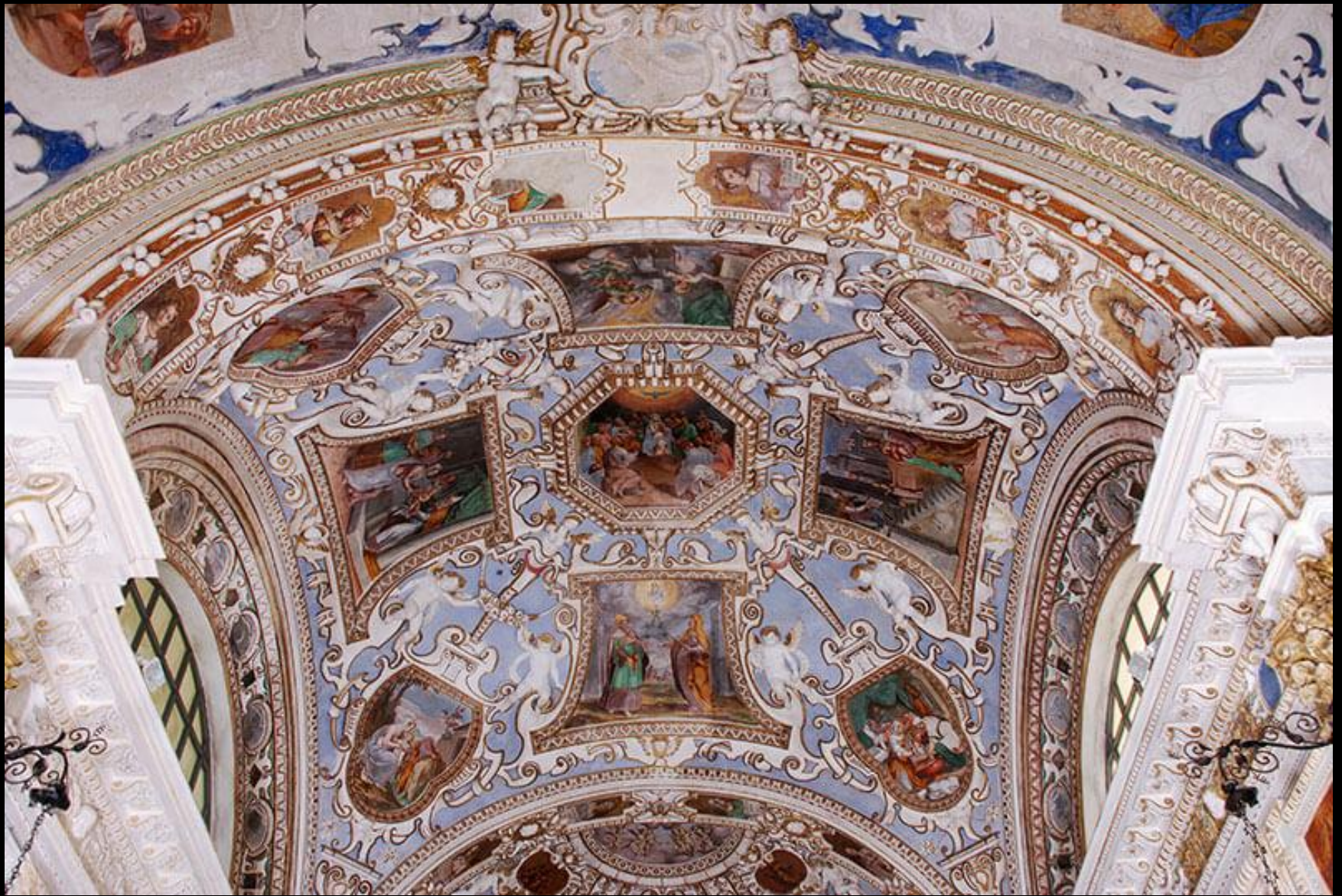
Antonino Parentani e stuccatore ticinese, Storie di Cristo e della Vergine , certosa di Pesio, 1610