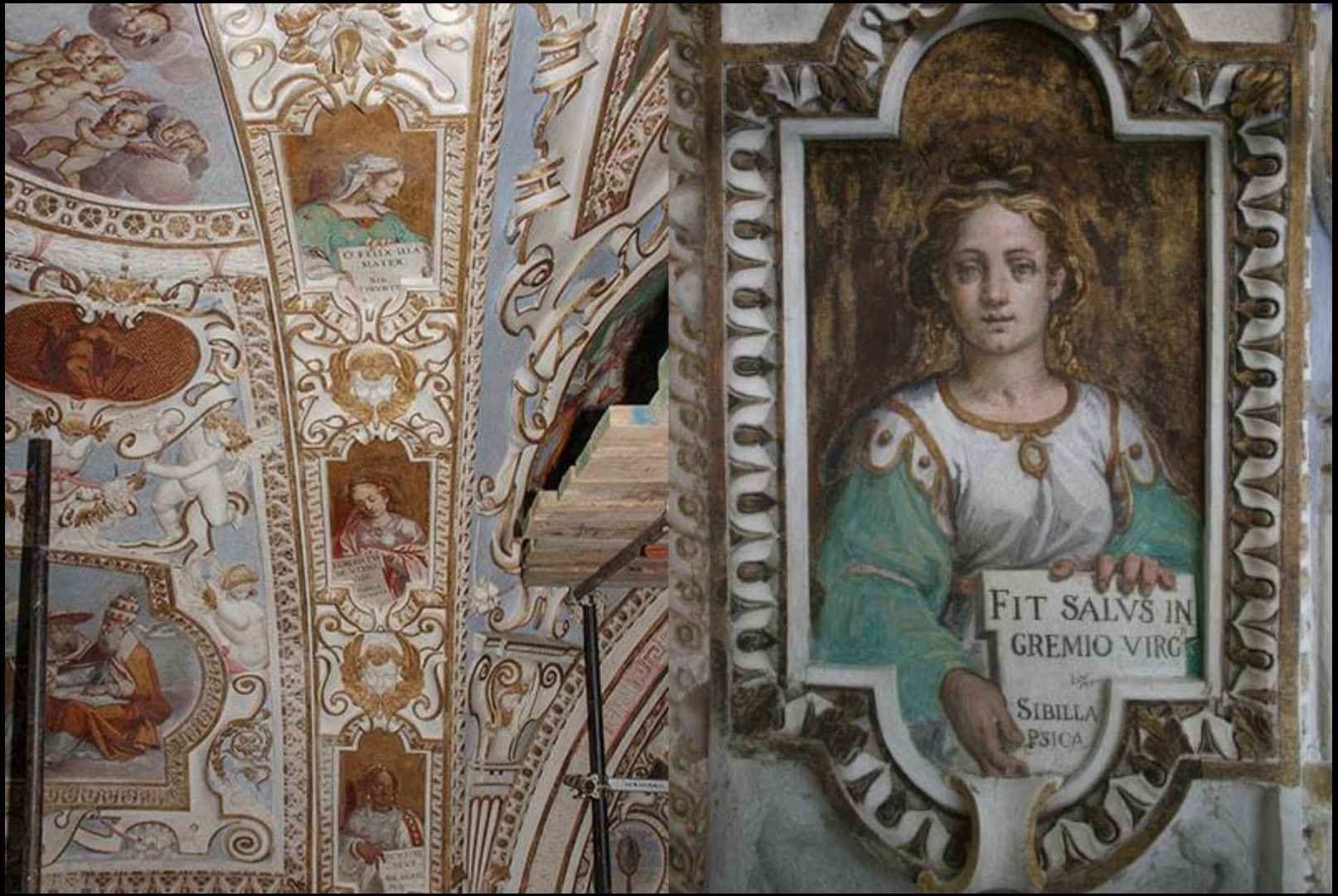
Antonino Parentani, Sibilla Persica , certosa di Pesio, 1610.