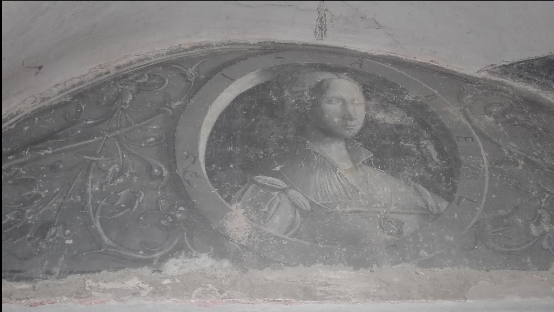
Pietro Dolce, Isabella , Ceva, loggia di casa Pallavicino, 1550 circa.